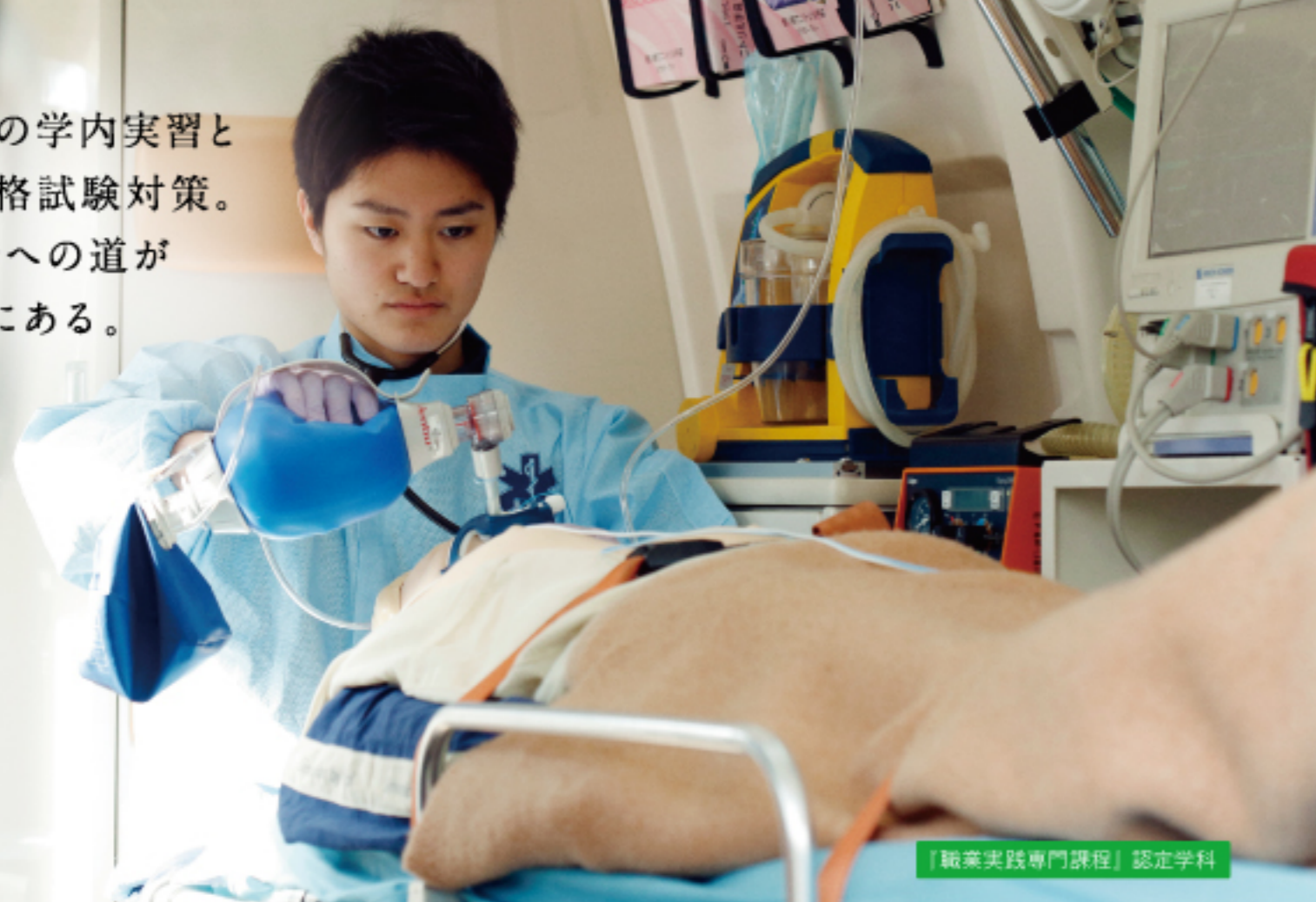
「職業実践専門課程」認定学科

現場レベルの学内実習と徹底した資格試験対策。救急救命士への道がすぐ目の前にある。