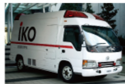
専門学校では珍しい実習の救急車をはじめ、実車の医療機器をフル装備した実習専用車で練習力を高める。