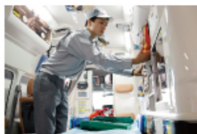
手厚いサポートと豊富なニーズに応える人材育成カリキュラムで、卒業生は全国各地の消防機関や病院で活躍しています。