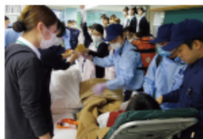
他職種と連携して学ぶ授業を実施。同一分野だけでなく、他分野の学科もたくさんある本校ならではの授業を展開しています。